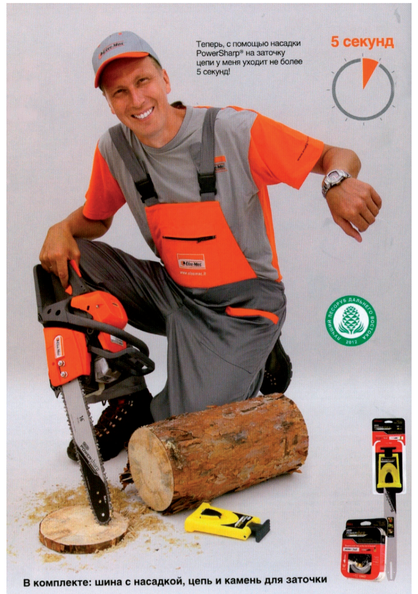
В комплекте: шина с насадкой, цепь и камень для заточки

Любой инструмент из модельного ряда продукции станет вашим надежным помощником при создании красоты и ухоженности в саду или на даче. Надежность, качество и практичность итальянского инструмента по достоинству смогли оценить миллионы людей во всем мире, в том числе и наши соотечественники.